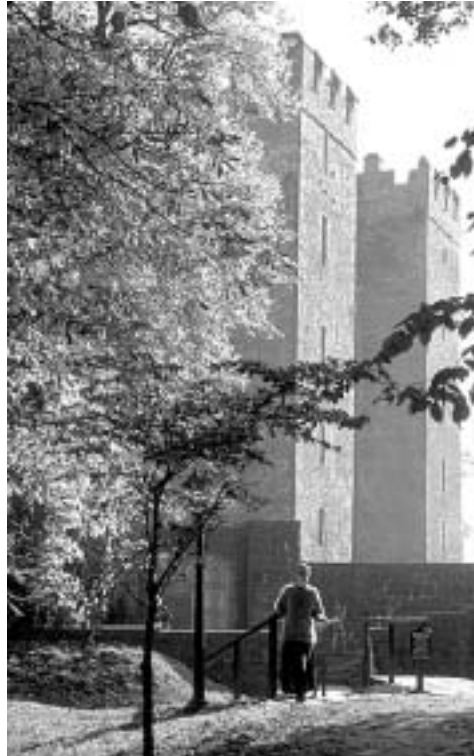
Publikumsmagnet Bunratty Castle

Die dünne Besiedlung hat in Clare viele archäologische Stätten vor der Zerstörung bewahrt. Am bekanntesten und am häufigsten fotografiert ist der Poulnabrone-Dolmen , doch daneben gibt es noch 2000 keltische Ringforts und 250 Burgen, zumeist einfache Wehrtürme, die von den gälischen Clanchefs im 15. und 16. Jh. errichtet wurden. Die großzügigen Parks und Landsitze, wie sie vor allem um Dublin Akzente setzen, sucht man hier ebenso vergebens wie die normannischen Bilderbuchburgen, zu denen John's Castle in Limerick durchaus zu rechnen ist. Bleibt die Musik. Clare gilt als das „Singing County“, die Hochburg der traditionellen irischen