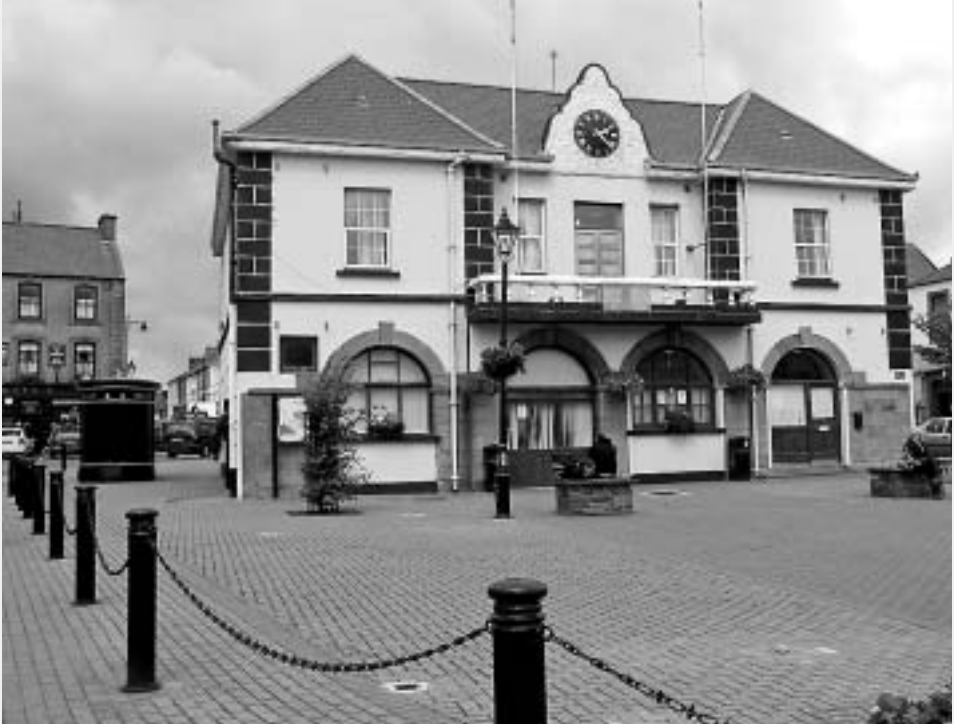
Das Rathaus von Kilkee