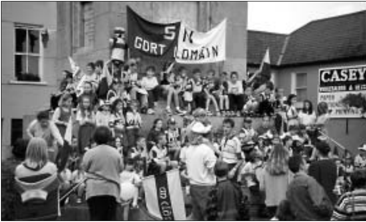
County Clare im Endspiel um den irischen Football-Cup